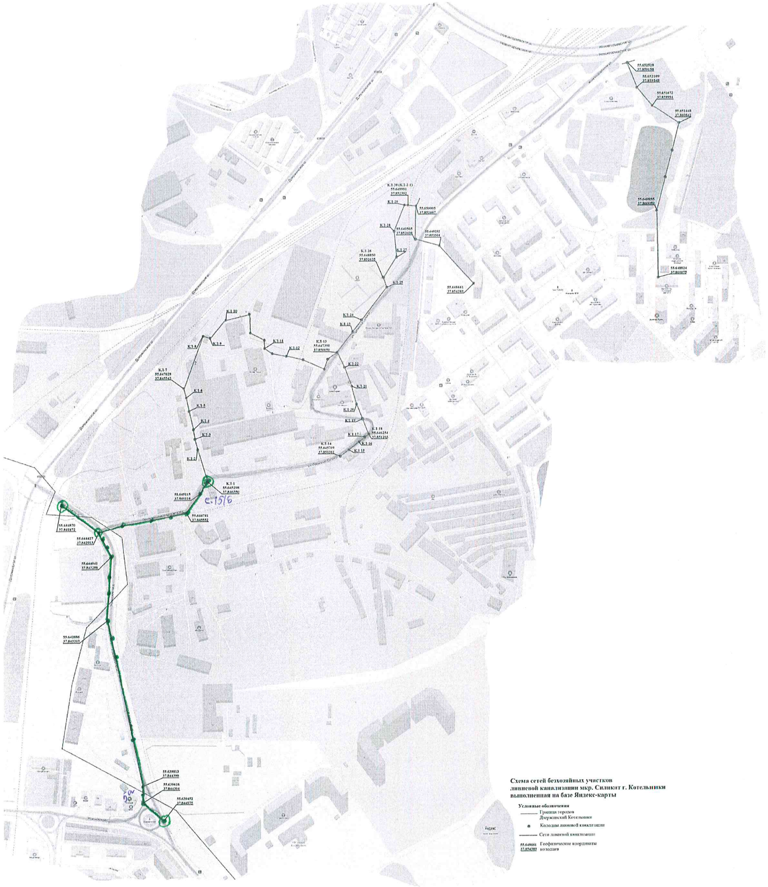
Схема сетей безхозяйных участков линейной канализации мкр. Спидикт г. Котельники выполненная на базе Индекс-карты